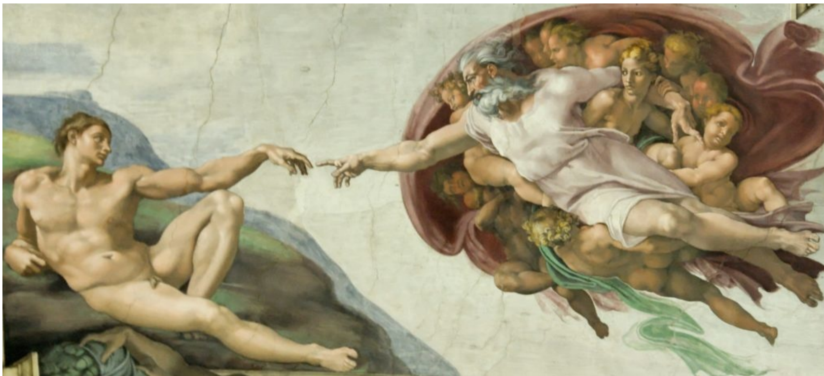
«Сотворение Адама» — фреска Микеланджело (1511 год).

обучение хирургов качественно и безопасно выполнять эндоскопические вмешательства.