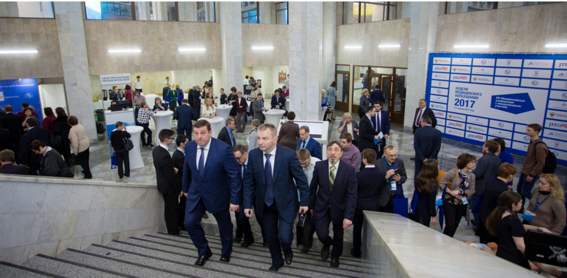
«Неделя медицинского образования в Москве», апрель 2017, Москва;