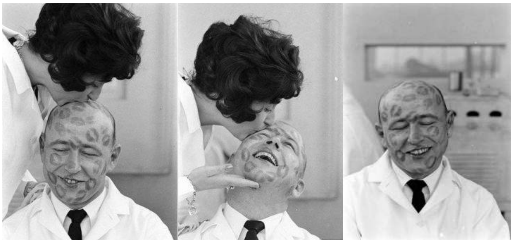
Тестирование губной помады 1950-е